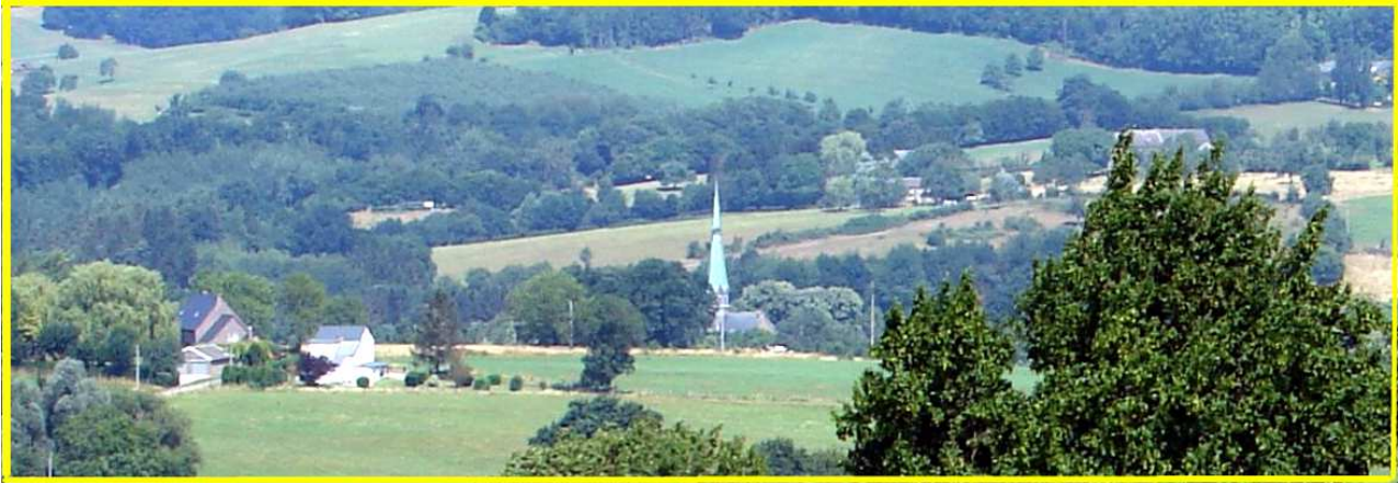
Vers Aubel, La Clouse et Henri-Chapelle.