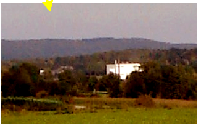
La laiterie de Walhorn