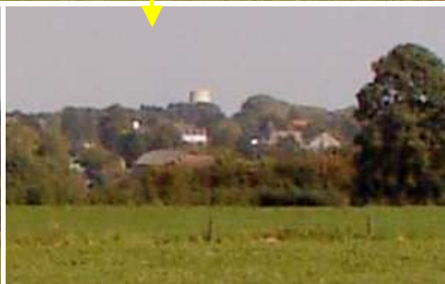
Le château d'eau de Eynatten