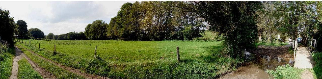
PV 35 (WP 190)

PV 34 (WP 189) : Un gué sur la Gueule, la passerelle pour les piétons et la vue sur le fond de la vallée de la Gueule qui fait partie du PIP. De nombreux chemins et sentiers relient entre eux les différentes zones habitées.