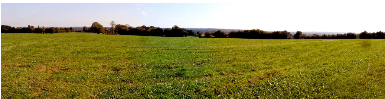
La vue à l'est vers les boisements