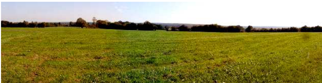
La vue à l'est vers les boisements